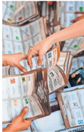
La consultora documentó robo de urnas con sufragios durante la pasada contienda del 2 de junio.

También plantea una reforma político-electoral que permita anular las votaciones cuando se compruebe la intervención del crimen organizado en cualquiera de sus modalidades: violencia política, imposición de candidatos, financiamiento de precampañas y campañas proselitistas, movilización o desmovilización del voto e intervención en las casillas de votación. ●