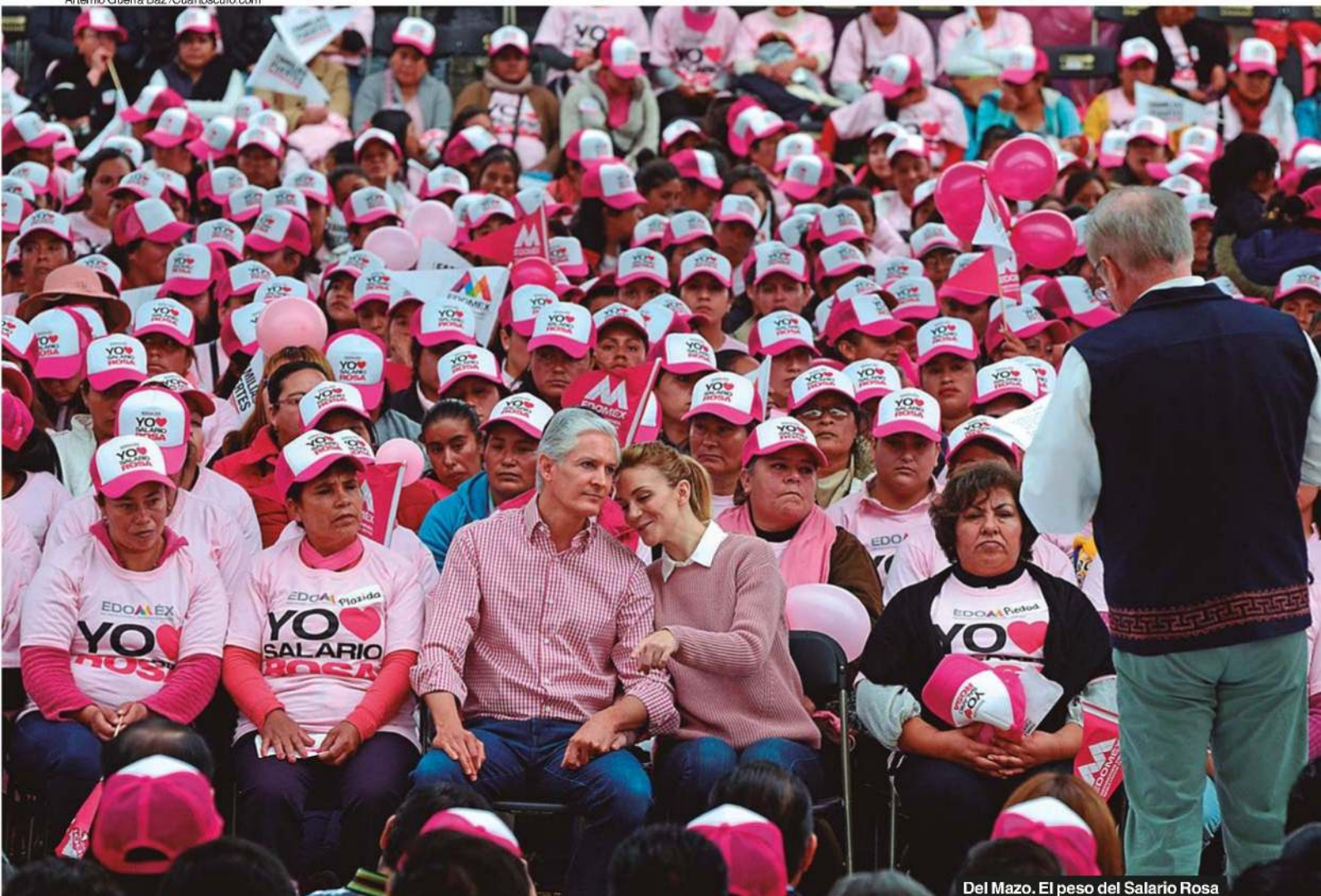
Del Mazo. El peso del Salario Rosa