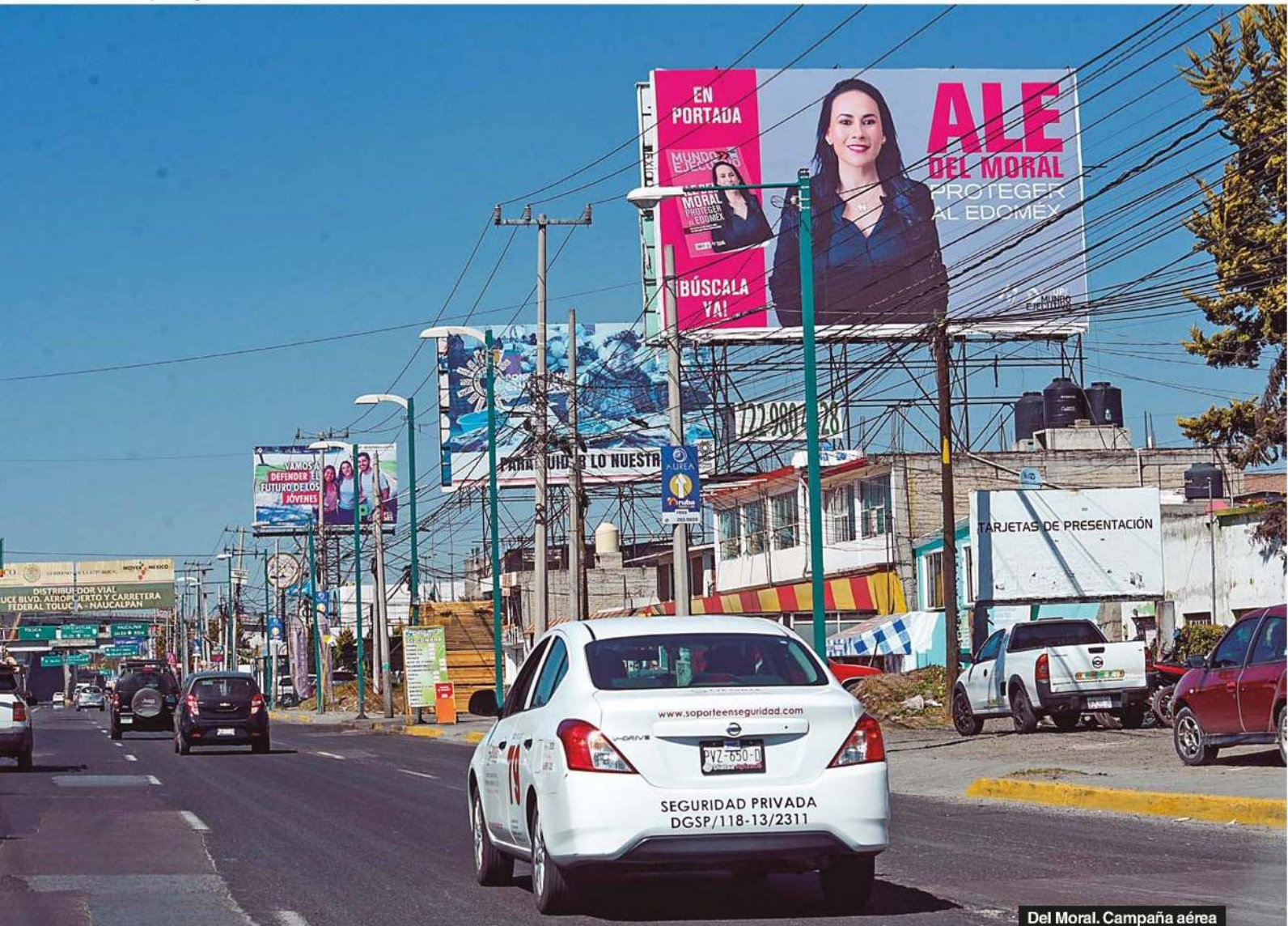
Del Moral. Campaña aérea

estos operadores recibe salario porque están conscientes de que la paga será política (una futura candidatura) y negó que el gobernador Alfredo del Mazo o los alcaldes en funciones formen parte de la estructura electoral: “Se tiene la idea de que hay mucha intervención, pero la ley ha cambiado mucho, tienen que dedicarse a gobernar bien porque (así) nos prestigian”.