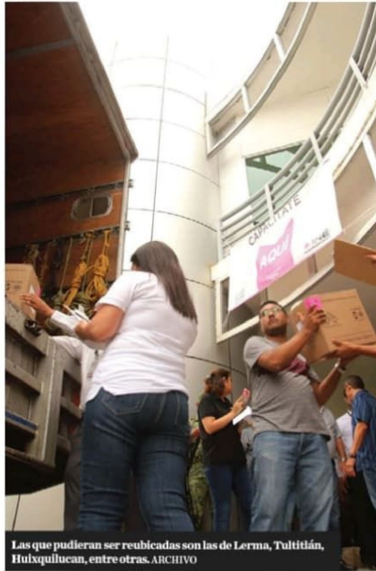
Las que pudieran ser reubicadas son las de Lerma, Tultitlán, Huixquilucan, entre otras. ARCHIVO

Las Juntas deben sesionar por lo menos una vez al mes, durante el proceso electoral y proponer al Consejo Distrital correspondiente el número de casillas que habrán de instalarse en cada una de las secciones comprendidas en sus distritos, formular la ubicación de casillas, capacitar a las personas que se habrán de integrar las mesas directivas de casilla, entre otras funciones.