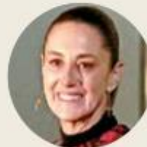
● Claudia Sheinbaum Pardo

Hay expresiones que por su sonoridad, o descuido, llegan a marcar una biografía pública: ni los veo ni los olgo, no traigo cash , ¿y yo por qué? Quizá la presidenta Sheinbaum produjo ayer una con su “paso”. No es que haya abrazado al régimen criminal de Maduro , pero a fin de cuentas soltó el “paso” como respuesta a una pregunta que la invitaba a fijar una posición más allá de la pálida y moldeable tesis de la autodeterminación de los pueblos. El gobierno mexicano, la Presidenta, el canciller De la Fuente saben que las únicas copias de las actas electorales exhibidas revelaron el triunfo del candidato Edmundo González , pese a la desventaja épica con que la oposición fue a la contienda, y que la autoridad electoral venezolana nunca dio a conocer los resultados desglosados por mesa de votación para que se sometieran a un escrutinio independiente. Saben que el régimen de Maduro ahogó con represión, balas, muerte, cárcel y tortura a más de 2 mil opositores. Sin embargo, el gobierno mexicano estará presente mañana, así sea con un personaje minúsculo, en la ceremonia que convalidará la perpetuación de Maduro en el poder. Son los hechos. Paso.