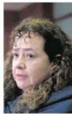
Claudia Paz y Paz

:::: Nos cuentan que Claudia Paz y Paz , exintegrante del Grupo Interdisciplinario de Expertos Independientes que acompañó la investigación