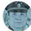
LUIS CRESENCIO SANDOVAL

» Mucho se ha especulado sobre una eventual renuncia de Omar García Harfuch a la Secretaría de Seguridad de la CDMX, para buscar la candidatura a Jefe de Gobierno. Sobre todo, después de que la alcaldesa en Iztapalapa, Clara Brugada , anunció su interés por esa postulación. El funcionario capitalino tiene hasta el sábado para informar si compete o no.