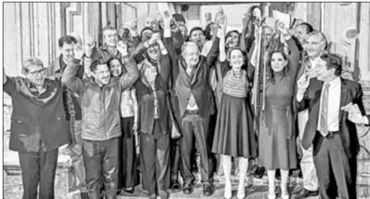
▲ El presidente Andrés Manuel López Obrador entregó anoche el bastón de mando