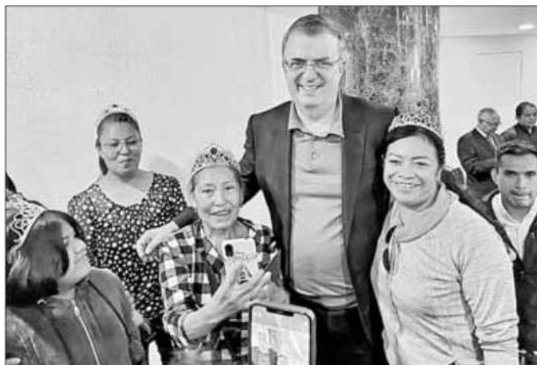
▲ Durante una conferencia de prensa en la CDMX, Marcelo Ebrard propuso una