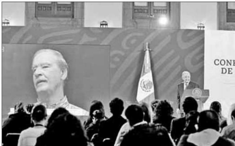
▲ En su conferencia matutina en Palacio Nacional, el Presidente manifestó que “la