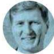
ENRIQUE DE LA MADRID

› Nadie acusó recibo del reclamo que hizo Xóchitl Gálvez entorno al respaldo que obtuvieron, de la noche a la mañana , algunos aspirantes presidenciales del Frente Amplio por México, pero fuentes cercanas a esa alianza, nos dicen que el reproche tenía como destinatarios a los perredistas Silvano Aureoles y Miguel Mancera . Y al panista Francisco Javier García Cabeza de Vaca , quien, en un abrir y cerrar de ojos , obtuvo una casca de firmas de apoyo.