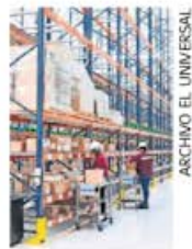
Interior de la megafarmacia

:::: Nos hacen ver que ayer, en la sección "El Pulso de la Salud", en la "mañanera", "callaron como momias" ante el revelador, y oficial, dato de que la Megafarmacia del Bienestar solo ha surtido 341 recetas en cuatro meses de operación. El dato,