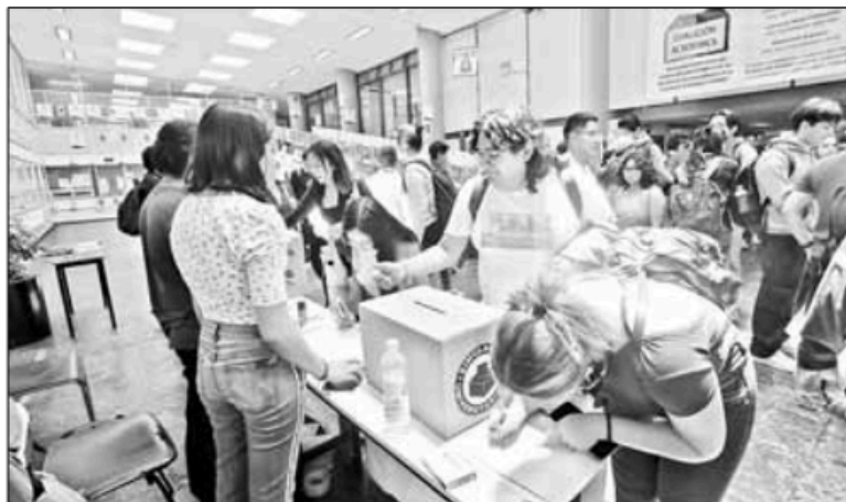
▲ Simulacro electoral ayer en Ciudad Universitaria para elegir al presidente de la República. Hubo actividad en la mayoría de