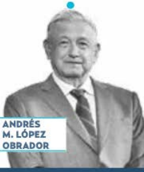
ANDRÉS M. LÓPEZ OBRADOR

› Ya en la recta final de su sexenio, en el último mes de su gobierno, el presidente López Obrador sí recorrerá el país. Pero no será con su denominada "gira del adiós", sino que se tratará de visitas al menos a 23 estados para supervisar que esté funcionando de manera adecuada el programa IMSS-Bienestar. No se descarta que vaya a entidades que no gobierna su partido o afines a la 4T, como Nuevo León y Jalisco. Será, dice, del 2 al 14 de septiembre próximo.