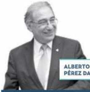
ALBERTO PÉREZ DAYÁN

› La Consejería Jurídica del Ejecutivo Federal lanzó un nuevo reclamo un día antes del debate del Plan B en la Suprema Corte de Justicia, que a decir del ministro Alberto Pérez Dayán , se aprobó sin una discusión abierta e informada entre legisladores. Y ahora la Presidencia advirtió que, de invalidar el proceso legislativo, el máximo tribunal estaría sustituyendo al Congreso y asumiendo atribuciones que no le corresponden.