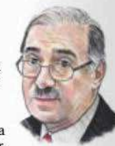
Alberto Pérez Dayán

A PROPÓSITO DE la Suprema Corte de Justicia de la Nación, que preside Norma Piña, hoy se discutirá el proyecto del ministro Alberto Pérez Dayán que propone declarar inconstitucional el llamado Plan B de la reforma electoral de Andrés Manuel López Obrador. Para quienes conocen cómo se están moviendo las cosas por el rumbo de Pino Suárez, el Presidente de la República perderá este lunes por goliza. Nueve a dos o de plano 10 a 1 en contra de las intenciones del tabasqueño de reformar las leyes electorales antes de las elecciones presidenciales del 2024. La duda es cuál de las ministras podría decantarse por el proyecto: ¿Yasmín Esquivel o Loretta Ortiz?