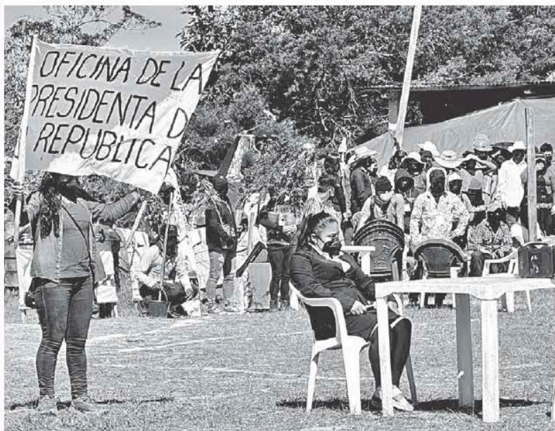
Mesa femenina de los Encuentros de Resistencia y Rebelión. ESPECIAL.

“A cuatro años de la toma del INPI, nada ha cambiado. Como mujeres que somos, seguimos en resistencia”