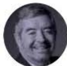
JUAN RAMÓN DE LA FUENTE

► Todas las garantías ofreció la jefa de Gobierno, Clara Brugada , a los contingentes y personas que acudan este sábado a las marchas por el 8M, en la Ciudad de México. "Son bienvenidas todas las manifestaciones, movilizaciones y la gran marcha histórica del 8 de marzo", dijo tras presentar una agenda de equidad, conformada por 13 puntos.