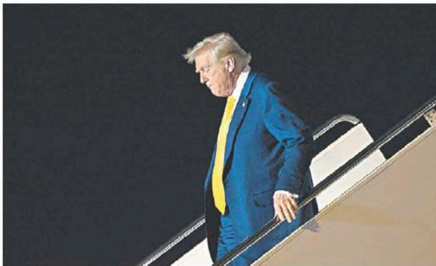
La incertidumbre, su principal recurso para avanzar en la agenda.