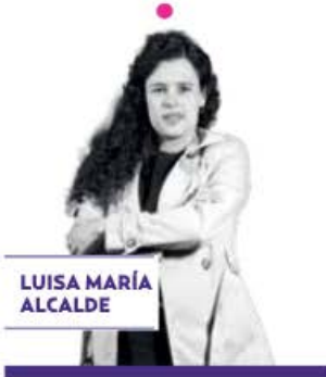
LUISA MARÍA ALCALDE

► Tremenda grilla se está armando en Morena por la decisión de su dirigente nacional, Luisa María Alcalde , de incluir en los estatutos del partido la prohibición al nepotismo, desde 2027, en cargos de elección popular. Un sector está en total desacuerdo con la medida y busca evitar que dicho candado se plasme en sus documentos básicos. El caso es que todo indica que la lideresa no la tendrá fácil, pues manos de San Lázaro y el Senado están meciendo la cuna para impedir que lo concrete.