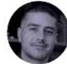
OMAR GARCÍA HARFUCH

► Este lunes, el INE, presidido por Guadalupe Taddei , inicia la impresión de las boletas que se usarán para elegir a cinco magistrados del Tribunal de Disciplina Judicial. Son 38 aspirantes para ese cargo: 20 mujeres y 18 hombres. Por cierto, el avance en la impresión de las papeletas para toda la elección está en 55.8 por ciento.