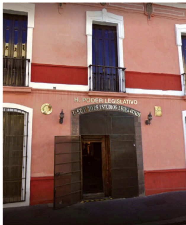
El registro se puede realizar también en el Inesle. ESPECIAL

Entre la documentación que se requiere, está proporcionar