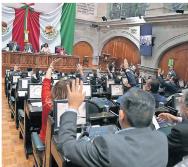
El Comité verificará que los registros cumplan requisitos.

Los interesados en participar en este proceso electoral deben registrarse entre el 11 y el 16 de febrero de 2025 a través del microsítio habilitado http://legislativoedo-mex.gob.mx/eleccionjudicial2025 , donde deberán crear una cuenta con su CURP y número de cédula profesional. Además, tendrán que presentar diversos documentos que acrediten su elegibilidad, como el acta de nacimiento, título de licen-