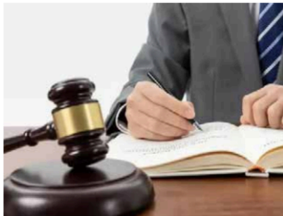
El Comité de Evaluación del Poder Legislativo del EdoMéx evaluará la idoneidad de los aspirantes entre el 20 y 24 de febrero.

Asimismo, se pedirá que los aspirantes indiquen su autodeterminación de género, si tienen alguna condición de discapacidad y requieren ajustes razonables, o si pertenecen a alguna comunidad indígena o afro mexicana. Esto se realiza con el fin de implementar medidas afirmativas durante el proceso de evaluación.