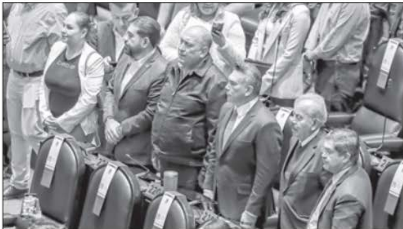
▲ Sesión solemne de la Cámara de Diputados por el 107 aniversario de la Constitución, en la que no faltó la confrontación entre Morena y