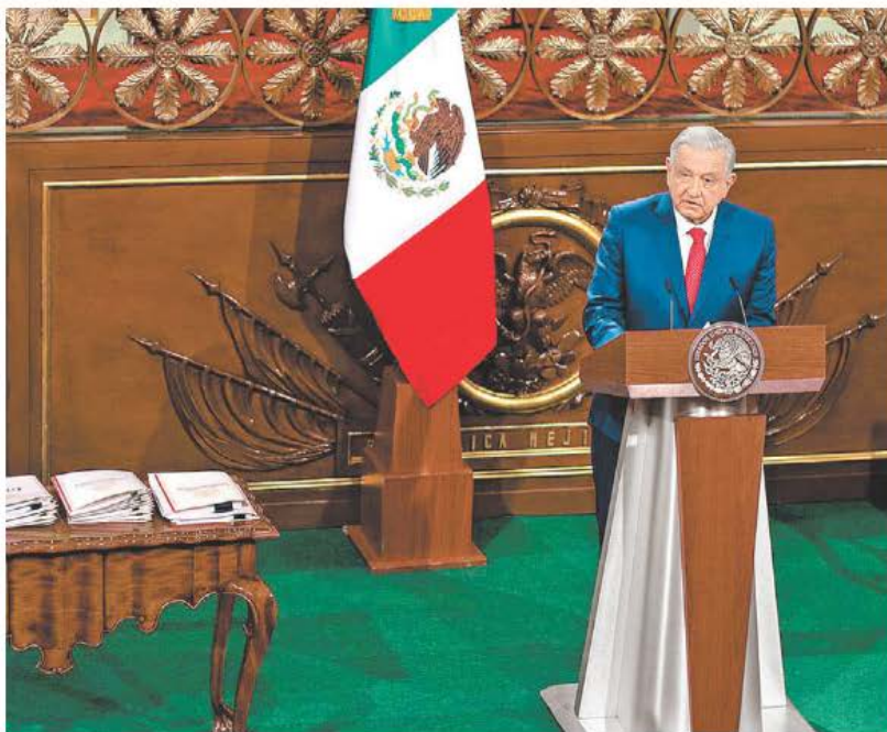
López Obrador presentó sus propuestas el lunes pasado en Palacio Nacional.

Pero también es cierto que, en este testamento político de López Obrador, se cuecen algunas que responden a su muy particular manera de interpretar a la sociedad mexicana, producto de su trayectoria y procedencia. Algunas, las menos afortunadas, son propuestas que no abonan al intento de modernizar y pluralizar la vida política y social. El empoderamiento del Ejecutivo y el fortalecimiento unilateral del poder presidencial no necesariamente representan banderas de los sectores preocupados por la justicia y la desigualdad. A ratos parecería que el diseño de Estado que propone López Obrador parte del principio de que la presidencia siempre será ocupada por una fuerza política inclinada a las causas justas y progresistas. Sorprende en alguien que conoce la historia tan bien como él. Imposible saber quién goberna