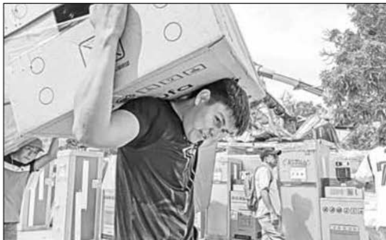
▲ Autoridades federales entregaron ayer enseres domésticos a los afectados por el