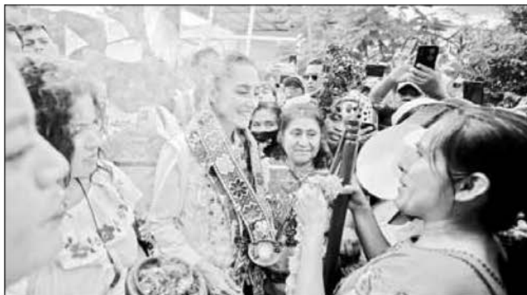
▲ Claudia Sheinbaum tardó una hora en subir al estrado, debido a que sus simpatizantes le pedían fotografiarse o la detenían para darle obsequios.