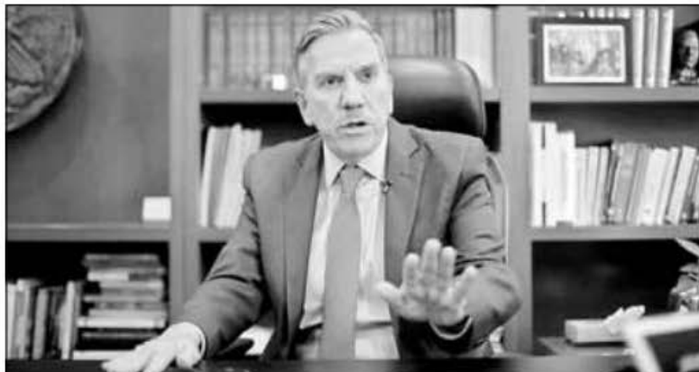
▲ El ministro Javier Layneza Potisek frenó la extinción de 13 fideicomisos del Poder Judicial de la Federación.

Twitter: @cafevega cfmexico_sa@hotmail.com