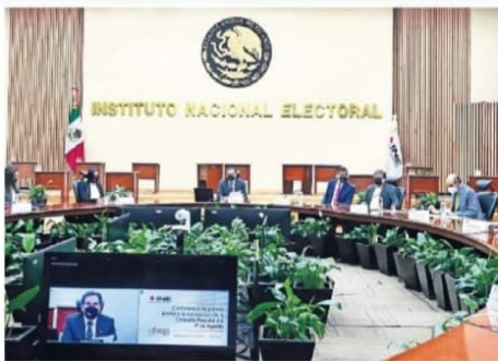
Los descuentos al presupuesto del INE derivan en afectaciones a las actividades operativas y funciones sustantivas del órgano que prepara los procesos electorales en el país.

De acuerdo con el dictamen de la Comisión de Presupuesto y Cuenta Pública del proyecto de decreto del Presupuesto de Egresos de la Federación —que se espera sea presentado hoy lunes para su análisis, discusión y eventual aprobación—, la autoridad electoral tendrá un recorte de 4 mil 475 millones de pesos para el siguiente año. Sería el segundo tjeretazo