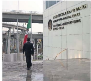
Dentro de los recortes planteados al Poder Judicial, el más afectado será el Consejo de la Judicatura Federal, con mil 286 mdp menos.

"El INE no proporciona metodología ni estimaciones que permitan vincular la información objetiva de origen técnico con los montos a que hace referencia"