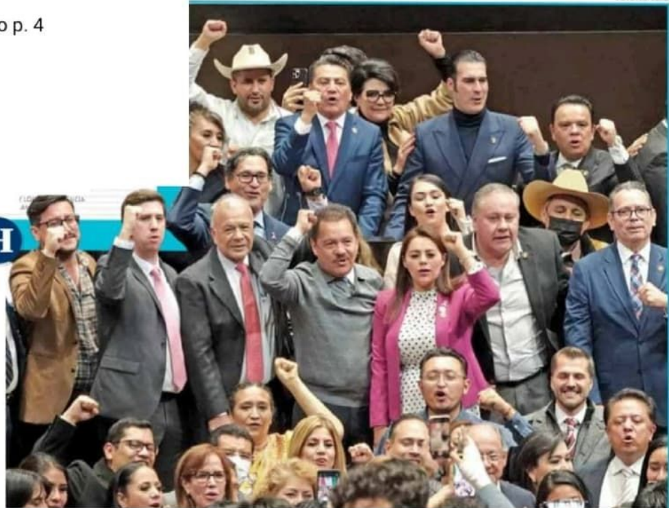
• DEBATE. La fracción parlamentaria de Morena en la Cámara de Diputados prevé empezar el análisis del dictamen este lunes.

La Secretaría de Gobernación también registra un incremento de 47.5 millones de pesos y se prevé sean reorien-