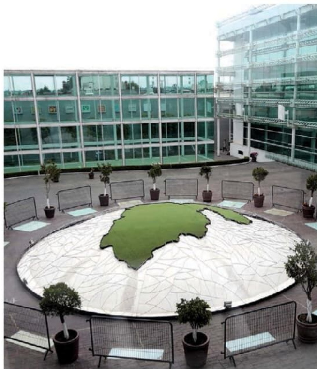
El plazo vence el próximo 25 de noviembre.

La presidenta señaló que todavía hay tiempo para que lleguen hombres y mujeres interesados