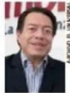
Mario Delgado Carrillo

En la política dicen que la forma es fondo. Le contamos que en la gira que realiza la jefa de Gobierno, Claudia Sheinbaum , por las 16 alcaldías hay un líder político que ha estado presente en cuatro de los seis eventos. Se trata del dirigente nacional de Morena, Mario Delgado , quien está en el presidium, pero no toma la palabra. Sin embargo, a algunos les ha empezado a llamar la atención la presencia de don Mario en estos eventos por varias razones. Una, es líder del Instituto político que tiene entre sus cartas para 2024 a doña Claudia. El punto es que don Mario ha estado acompañando a la mandataria, hasta hoy, como convidado de piedra.