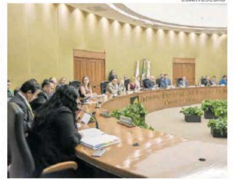
El siguiente año se renovarán unos mil 300 cargos

‘Igual en este proceso tuvimos un recorte de 100 millones por el propio Ejecutivo, nos ajustamos al recorte, hicimos las previsiones necesarias para que esto no impactara y garantizar y ofrecer una elección con transparencia, una elección limpia y que diera certeza a la ciudadanía y