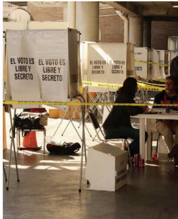
Se cuidarán los procesos de adquisición y licitación, así como las compras directas, resaltó la titular del instituto.

Entre las medidas que han implementado desde procesos anteriores es la reutilización de material electoral, con importantes ahorros. “Desde ahora estamos haciendo el análisis y por supuesto que el instituto siempre tiene la política de re-