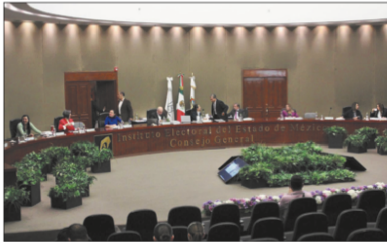
▲ El Consejo General ofreció diálogo y disposición a los poderes Ejecutivo y Legislativo.