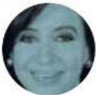
CRISTINA FERNÁNDEZ DE KIRCHNER

› Empezaron a girar las invitaciones para la rendición de protesta de Claudia Sheinbaum como presidenta de México. Y uno de los primeros convocados es el presidente de Rusia, Vladimir Putin , de acuerdo con la agencia de noticias rusa TASS. "Putin recibió una invitación para la toma de posesión de la nueva presidenta de México, el 1 de octubre", indica el reporte. La información, dice la agencia de noticias, fue proporcionada por personal de la embajada mexicana en Moscú.