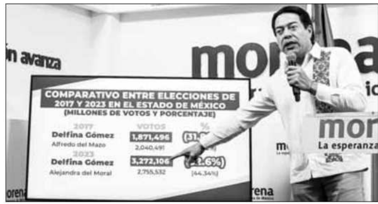
▲ En la cena del lunes con aspirantes presidenciales, López Obrador los llamó a la