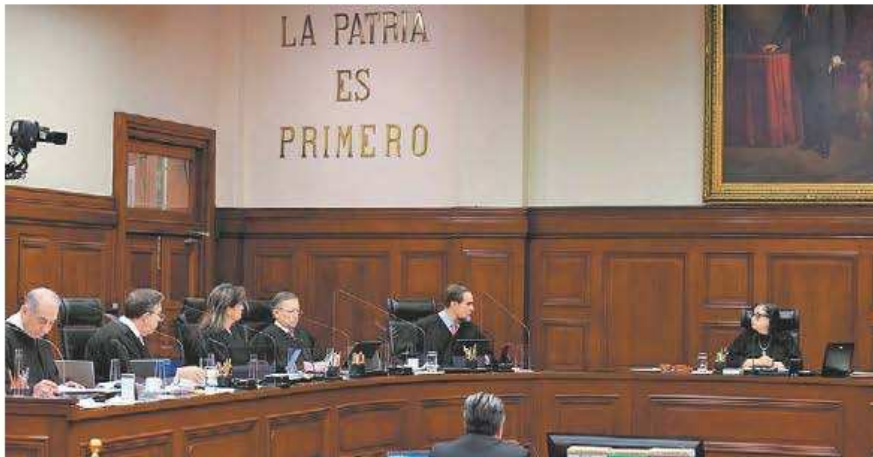
Debate en la Suprema Corte de Justicia de la Nación. ESPECIAL

Por otro lado, la Corte había venido invalidando, en legislaciones estatales, este requisito de contar con “modo honesto de vivir” para acceder a cargos públicos por la imposibilidad de establecer, sin generar discriminación o lesionar derechos humanos, qué modo de vivir es ese.