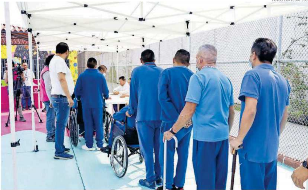
La población del penal Neza-Bordo ingresó la documentación en un sobre que estará cerrado en lugar de urna