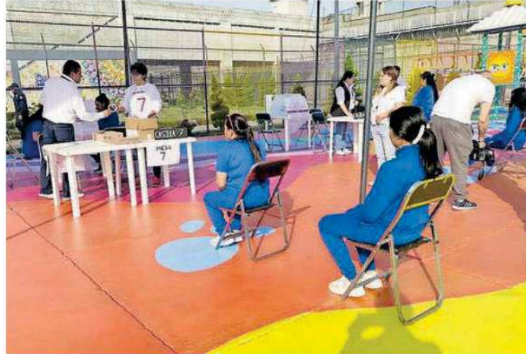
Del total de las PPL de Neza-Bordo, sólo 10 por ciento son mujeres

na discapacidad fueron los primeros en sufragar, después lo hizo el resto de la población que aún no ha recibido condena.