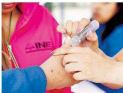
Para algunos podría ser la última vez que votan

Entre quienes participaron en este ejer-