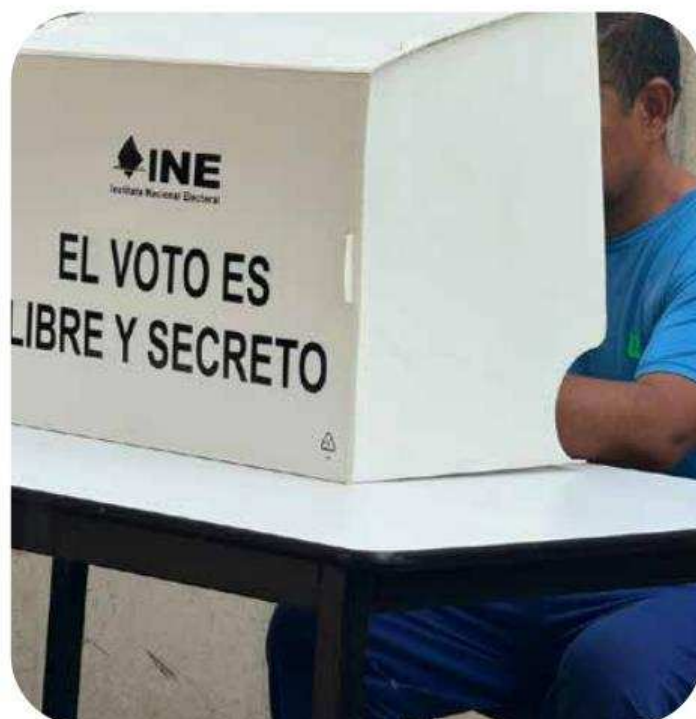
Este lunes en fue en Neza Bordo y Tenancingo

En Neza Norte; 19, Otumba; 71 Santiaguito en Almoloya de Juárez; 499 Tenancingo Sur; 30, Tenango del Valle; 116, Texcoco; 306, Tlalnepantla; 898, Valle de Bravo; 67, Zumpango; 106, Neza Sur; 16, Altiplano; 118 y Quinta del Bosque; 10.