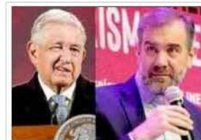
Lorenzo Córdova Vianello termina confrontado con AMLO