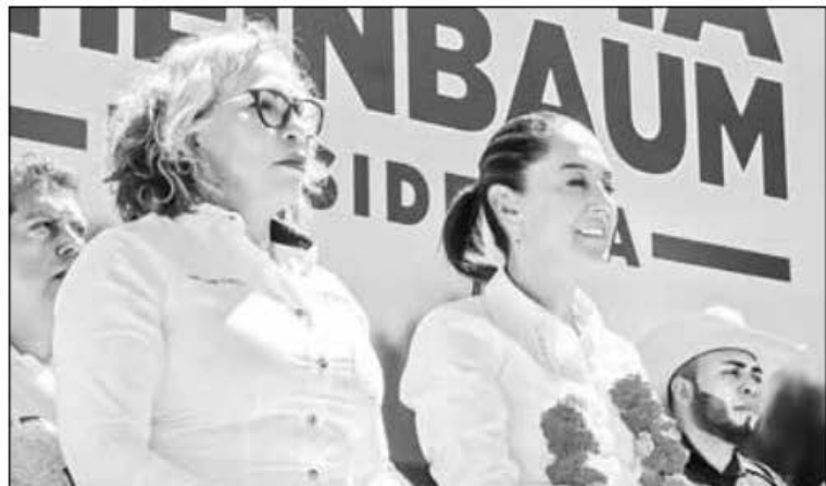
▲ No caer en ninguna provocación y “seguir atendiendo a los familiares de los 43 estudiantes de Ayotzinapa desaparecidos”, demandó Claudia Sheinbaum en gira por San Luis Potosí, tras la