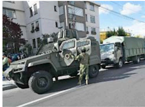
Elementos militares fueron desplegados para reforzar la seguridad en varias ciudades de Ecuador ante los comicios.

En la campaña, ha caminado con la camisa desabrochada hombro a hombro con soldados fuertemente armados, y usó chaleco antibalas mientras lideraba espectaculares operaciones de seguridad.