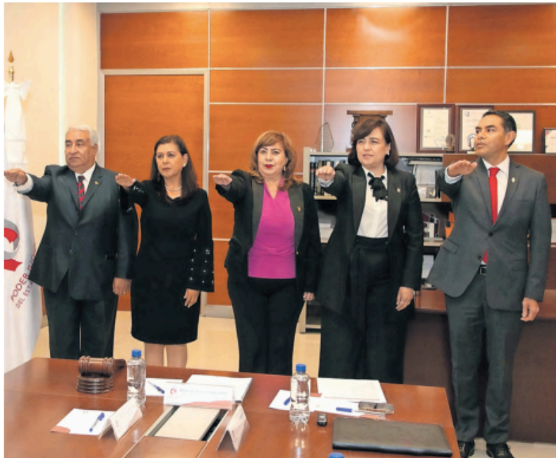
Ellos garantizarán que cumplan con los requisitos de elegibilidad para el Proceso Electoral Extraordinario 2025.