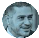
OMAR GARCÍA HARFUCH

› La presidenta del INE, Guadalupe Taddei , ya tiene en su agenda la reunión con la Presidenta Sheinbaum . Será el 9 de enero cuando la mandataria se encuentre con consejeros del Instituto para afinar detalles de la elección del Judicial. Hablarán, además, del tema presupuestal para que el proceso se lleve a cabo sin ningún contratiempo.