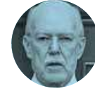
JUAN LUIS GONZÁLEZ ALCÁNTARA