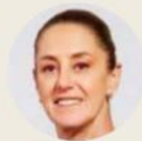
● Claudia Sheinbaum

grandilocuente pacto con los adversarios electorales, ni carnavalear por el arribo de México a la democracia, ni lanzar una ofensiva sin igual contra los grupos criminales, ni dedicarse a insultar a sus críticos cada mañana. Lo de ella fue más sencillo: concentrarse en la consumación de las troglodíticas reformas de López Obrador , que siempre validó. El tiempo evaluará las virtudes o vicios de esos cambios. Queda, por lo pronto, el registro de cómo comandó sin perder el temple la marcha arrolladora de su fuerza de asalto en el Congreso. "Son apenas 100 días de 2 mil 190", me dijo uno de sus asesores. Sí, es sólo el preludio. Muy exitoso.