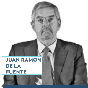
JUAN RAMÓN DE LA FUENTE

› Habrá un ejército de defensores de paisanos en Estados Unidos. Encabezado por el titular de la Secretaría de Relaciones Exteriores (SRE), Juan Ramón De la Fuente , nuestro gobierno pondrá en marcha una red consular en la Unión Americana y con un grupo de dos mil 610 abogados se prepara para dar asistencia legal a los connacionales que puedan sentirse en riesgo con las nuevas políticas implementadas por el presidente electo de Estados Unidos, Donald Trump .