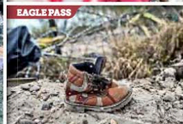
Las fronteras sur y norte de México concentran a miles de migrantes de prácticamente todo el mundo, que buscan llegar a Estados Unidos.