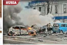
Algunos de los conflictos bélicos que siguen vigentes en el arranque de este nuevo año en diversos puntos del planeta.