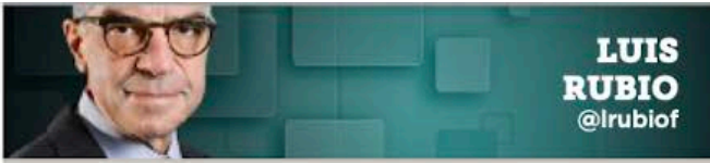
LUIS RUBIO @lrubiof

El próximo gobierno promete ser muy débil, circunstancia que podría remontar si modifica la propensión a pelearse con el Legislativo.