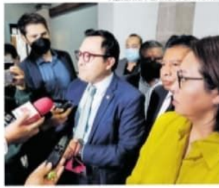
Legisladores de Morena.

quiere la gente, es una responsabilidad del presidente municipal y de las demás autoridades estamos en la mejor disposición de hacer la consulta".