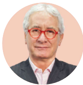
POR JAVIER SOLÓRZANO ZINSER

solorzano52mx@ yahoo.com.mx @JavierSolorzano