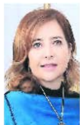
TOMADA DE X (TWITTER)