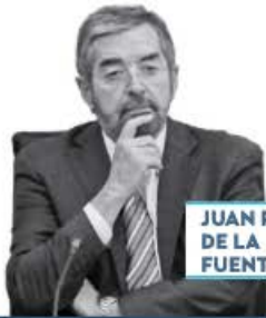
JUAN RAMÓN DE LA FUENTE

► Teje fino el ex embajador de México ante Naciones Unidas, Juan Ramón de la Fuente , en la tarea de elaborar el Proyecto de Nación de Claudia Sheinbaum . El también ex rector de la UNAM, tiene todo listo para comenzar con los Diálogos para la Transformación, que están a su cargo; incluso ya tuvo acercamiento con el Colegio de México para nutrir los temas de educación y cultura. Trae todo el respaldo de la virtual candidata presidencial de la 4T.