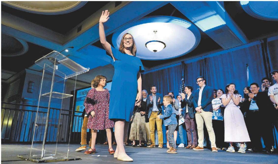
Sarah McBride, la primera persona transgénero en obtener una curul en EU.

El colombiano construyó su fortuna como comerciante de automóviles de lujo y empresario de blockchain; ahora llegará al Senado como uno de sus intergrantes más ricos. ■