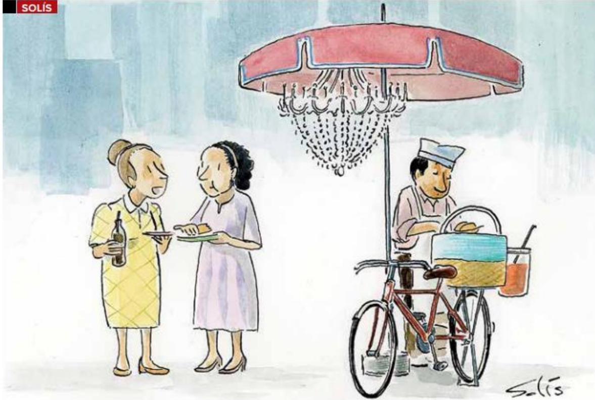
"Me siento como en Paris"