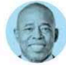
ERIC LEROY ADAMS

› Cayó muy bien entre la comitiva de EU, encabezada por Antony Blinken , la propuesta de la Semar, a cargo de Rafael Ojeda , para crear una coalición de países que supervise la importación de precursores químicos. Además, entre lo relevante del Diálogo de Alto Nivel están los compromisos bilaterales de perseguir a los traficantes de fentanilo, de armas y de personas.