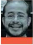
HUGO ERIC FLORES PRESIDENTE DEL PES MORELOS @HUGOERICFLORES