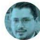
CARLOS MARTÍNEZ VELÁZQUEZ

Otro mandatario que confirmó su asistencia a la rendición de protesta de Claudia Sheinbaum como presidenta de México es el colombiano Gustavo Petro . Se prevé que llegue a nuestro país el 29 de este mes, por lo que le dará tiempo de reunirse con el presidente López Obrador , antes de que termine su mandato.