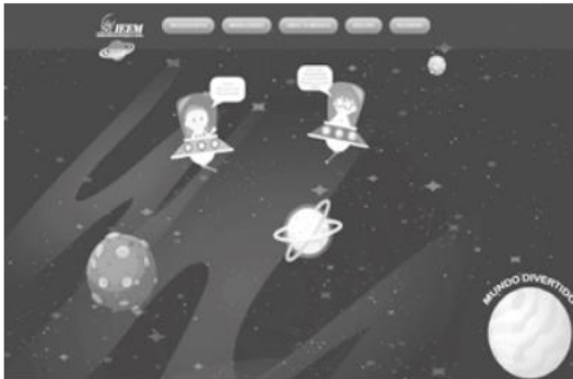
Consulta Infantil y Juvenil 2023.