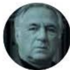
MIGUEL TORRUCO MARQUÉS

Y para seguir aprovechando el periodo vacacional, la Secretaría de Infraestructura, Comunicaciones y Transportes, que dirige Jorge Nuño Lara , mantendrá los descuentos en el servicio ferroviario y de auto-transporte. Las reducciones son de 50 y 25 por ciento para escolares y maestros. Estarán vigentes hasta el 26 de agosto de 2024.