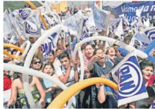
El PAN renovará su dirigencia nacional

U :::: El pasado miércoles, el CEN del PAN aprobó que, al menos una mujer pueda participar en la contienda interna para la renovación de la dirigencia nacional. Nos recuerdan que se busca garantizar que, de tener interés, al menos participe una mujer en la contienda aún si no reuniera el 10 por ciento mínimo de firmas que establecen los estatutos. En caso de que una o más mujeres decidan postularse y no alcancen el umbral de firmas requerido, se permitirá la participación de la mujer que obtenga el mayor porcentaje de firmas. Sin embargo, esta decisión no cayó nada bien en algunas mujeres panistas, quienes la consideraron "misógina". Nos cuentan que algunas mujeres panistas consideran esta opción como una ofensa porque parecería que por su género ellas no podrían alcanzar el umbral de firmas requerido y necesitan de "ayuda" para participar. La otra agravante que ven las mujeres es que quienes controlan los padrones en el PAN, podrían "apoyar" y postular a una mujer "testimonial" solo para legitimar la contienda interna con una candidatura afín a la actual dirigencia nacional. Nos adelantamos que habrá batalla legal para exigir una alternancia paritaria en el PAN.