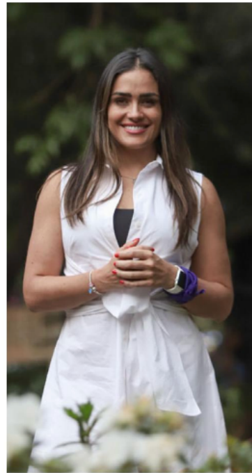
Rojo logró obtener 143 mil 70 votos, con 46.7398 por ciento de las preferencias.