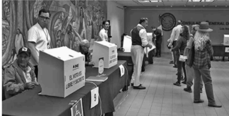
Votaron 14 mil 192 mexiquenses que viven en el extranjero.