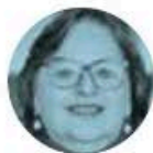
NORMA LUCÍA PIÑA

› Tendrá el INE, presidido por Guadalupe Taddei , la tarea histórica de promover y hacer valer, la votación anticipada de las personas en prisión preventiva, que se llevará desde hoy hasta el 20 de mayo. Esto es posible también por la coordinación con la Secretaría de Seguridad y Protección Ciudadana, encabezada por Rosa Icela Rodríguez , así como dependencias de seguridad locales, que realizaron una base de datos de las personas reclusas sin sentencia condenatoria.