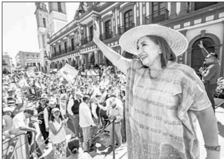
▲ La candidata de PRI, PAN y PRD durante un mitin ayer en Colima.