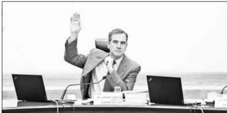
▲ La democracia cuesta y es cara, revela informe interno del INE que investiga gastos

X, antes Twitter: @cafevega cfumexico_sa@hotmail.com