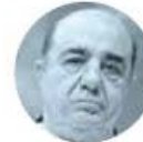
JESÚS MURILLO KARAM

► Los mejores oficios diplomáticos está aplicando la canciller Alicia Bárcena para que no empeore, más de lo que ya está, la relación con Ecuador. Tras la negativa del gobierno del presidente Daniel Novoa de otorgar el salvoconducto para asilar en nuestro país al exvicepresidente prófugo Jorge Glas , la funcionaria mexicana maneja el tema con mucho tacto.