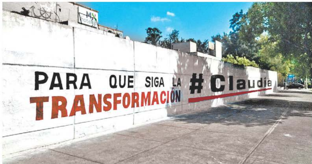
Fueron las huestes encargadas de la operación de pintar miles de bardas en favor de Claudia Sheinbaum. OCTAVIO HOYOS

Luego, los Servidores de la Nación levantaron el nuevo padrón de beneficiarios de los programas sociales, también repartieron recursos públicos y mantuvieron contacto con los líderes de las comunidades y los barrios.