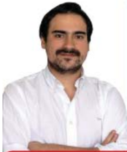
PEDRO SÁNCHEZ RODRÍGUEZ