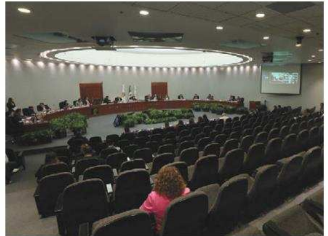
Los partidos cumplen, señalan.