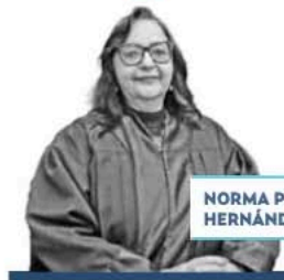
NORMA PIÑA HERNÁNDEZ

› Quien ya está aprovechando al máximo los reflectores mediáticos y marcando su propio estilo es la presidenta de la Suprema Corte de Justicia de la Nación (SCJN), Norma Piña Hernández , quien ayer tuvo un encuentro con juzgadores en el edificio del Poder Judicial de la Federación en San Lázaro y mañana martes encabezará la ceremonia del Día del Juzgador y Juzgadora Mexicanos, a quienes pidió trabajar sin miedo y con independencia.