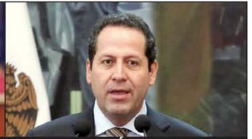
Eruviel Ávila Villegas

El próximo 3 de abril arrancan las campañas proselitistas, en forma, rumbo a la gubernatura del Estado de México , y en los últimos días, ha habido una que parece interminable guerra de "encuestas", las cuales, si son orquestadas por Morena , indican que la candidata morenista va a la cabeza; pero si las orquesta el PRI y su alianza PAN-PRD-NA , aseguran que la candidata se empareja.