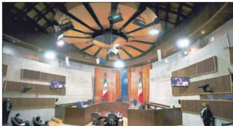
▲ Como la derecha no pudo frenar el plan B en el Poder Legislativo, ahora recurre al Tribunal Electoral del Poder Judicial de la