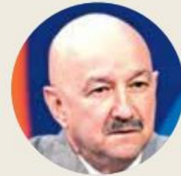
● Carlos Salinas de Gortari

López Obrador (71) pasa los días en Palenque, en donde, cuenta la leyenda, reflexiona y escribe, aunque otra leyenda cuenta que, desde allá, maneja delicadas cuerdas del poder, como la leyenda de Salinas hace 30 años.