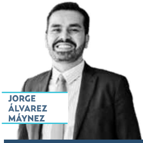
JORGE ÁLVAREZ MÁYNEZ

› Casi mero trámite resultará este jueves la elección del nuevo dirigente de MC. El ex candidato presidencial Jorge Álvarez Máynez llega como aspirante favorito, y la mayoría de los liderazgos lo respaldan. De hecho, Dante Delgado , quien hasta hoy ocupa ese cargo, adelantó que el zacatecano lo relevará porque en el emecismo hay unidad para ungirlo como nuevo dirigente nacional en la Quinta Convención Nacional Democrática, que se realizará en el World Trade Center.