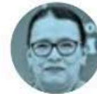
ROSA ICELA RODRÍGUEZ