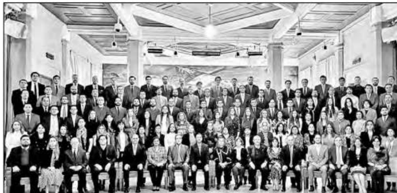
▲ La Suprema Corte de Justicia fue ayer escenario de la fotografía del Colegio de Secretarios con las ministras Norma Lucía Piña y Margarita Ríos Farjat, y los ministros

Facebook, TikTok, Twitter: galvanochoa Correo: galvanochoa@gmail.com