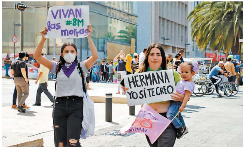
Mexicanas alzan su voz en las calles de la capital para exigir justicia. NAOMI ANTONIO

Las relaciones humanas son complejas, y la sensación de traición sentimental puede ser insoportable pero no somos dueños de los demás, aunque entren en nuestra vida. Y, no, una mujer no puede ser imputada como coautora de un