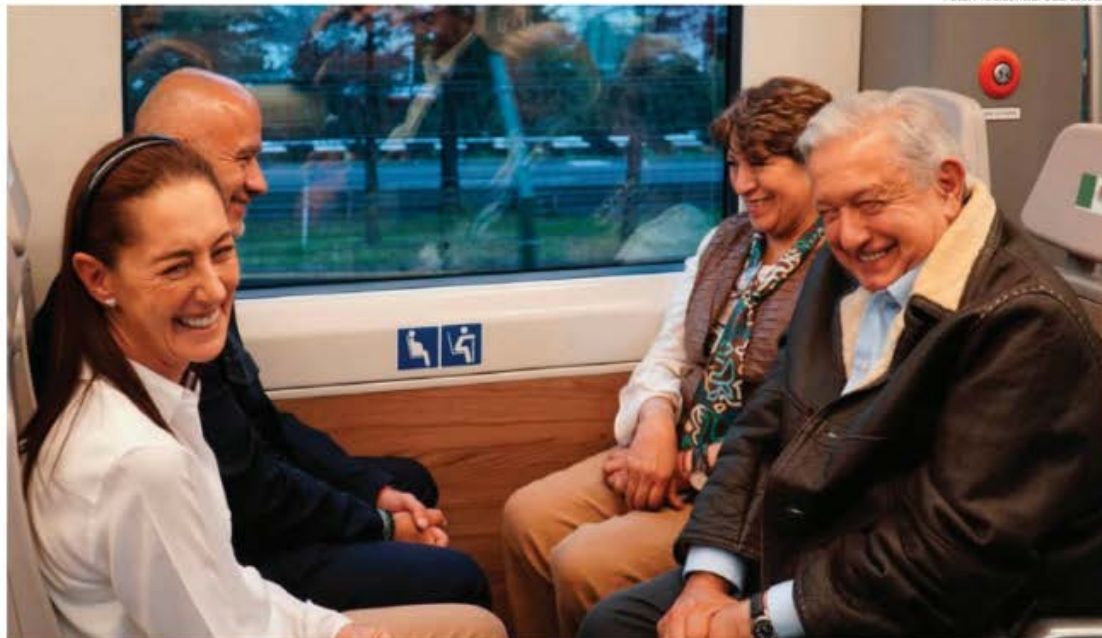
Claudia Sheinbaum Pardo, presidenta electa de México y Andrés Manuel López Obrador, presidente de México encabezaron la inauguración del Tren Insurgente en la estación Santa Fe.

aún en el contexto del presidencialismo mexicano, que permita suponer que eso es correcto. Se decía, por ejemplo, que Zedillo obedecería “a pie juntillas” a Carlos Salinas, y terminó encarcelando su hermano y obligándole a prácticamente un “auto destierro” en Irlanda. Vicente Fox, por su parte, era en efecto un lacayo, pero de su propia ignorancia y exabruptos. Calderón ejerció de manera vertical y autoritaria la presidencia y Peña Nieto hizo lo propio, hasta que él y todo su grupo fueron derrotados y prácticamente desaparecidos del escenario político nacional.