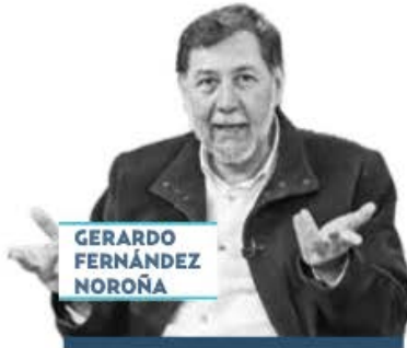
GERARDO FERNÁNDEZ NOROÑA

› Dos sesiones en el Senado faltan para sellar el destino del Poder Judicial: la minuta de la reforma, avalada por la aplanadora de la 4T en San Lázaro, llegó a la Cámara Alta, donde su presidente Gerardo Fernández Noroña la turnó a comisiones y auguró que “no hay poder sobre la tierra” que pueda frenarla. El martes se le dará primera lectura y el miércoles se sube al pleno. Según el petista tienen ya la mayoría calificada: “estamos sobrados, por encima de los dos tercios” de los votos.