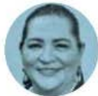
EL INE MIDE LOS TIEMPOS

› Nos dicen que uno de los más activos negociadores de la reforma judicial en el Senado es el líder de la bancada del PVEM, Manuel Velasco . El chiapaneco se ha destacado por su intenso cabildeo para convencer a legisladores de oposición de sumarse a la aprobación de la minuta. Su efectividad, nos dicen, se verá en la sesión del próximo miércoles.