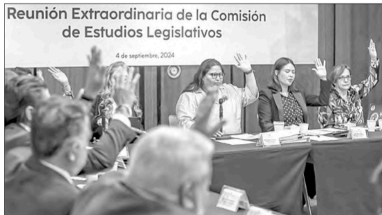
▲ Sesión en el Senado, en la que ayer se dio por recibida la minuta de la Cámara de Diputados sobre la reforma judicial.

X, Facebook, TikTok, Instagram: galvanochoa Correo: galvanochoa@gmail.com