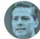
ENRIQUE PEÑA NIETO

› De visita en Palacio Nacional estuvo el líder del Partido Verde, Jorge Emilio González . Dijo que se entrevistó con el secretario de Hacienda, Rogelio Ramírez de la O , para plantearle la necesidad de invertir en áreas naturales protegidas, energías renovables para combatir el cambio climático, y destinar recursos a niños con cáncer.