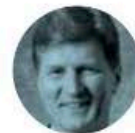
ENRIQUE DE LA MADRID

► Va funciona- do muy bien la Bi- tácora Electróni- ca de Seguimien- to de Adquisiciones, puesta en opera- ción hace año y me- dio por la Función Pública, encabe- zada por Roberto Salcedo . A la fecha se han registrado 2 mil 709 contratos en la Administra- ción Pública Fede- ral, por 339 mil 610 millones 500 mil pesos; el 80.1% del total de compras en CompraNet.