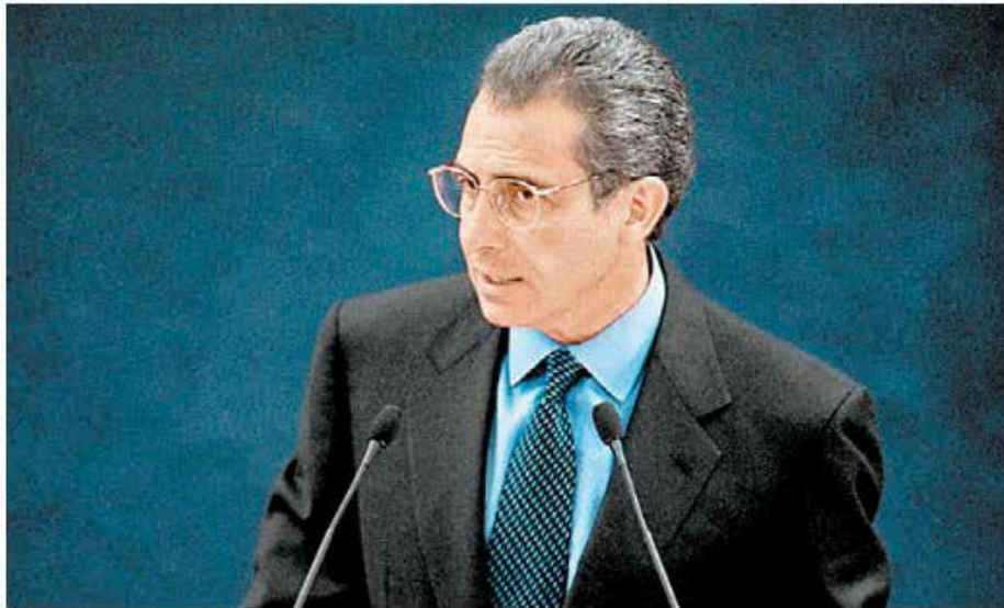
Ernesto Zedillo enfrentó condiciones adversas.