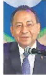
Rafael Guerra Álvarez

:::: Nos platican que, en aras de fortalecer la coordinación de todos los niveles de gobierno para mejorar la impartición de justicia, el magistrado presidente del Poder Judicial de la Ciudad de México, Rafael Guerra Álvarez , se reunió con el presidente de la República, Andrés Manuel López Obrador . En el encuentro, que se realizó de manera cordial y previo a la reunión nacional de la Comisión Nacional de Tribunales Superiores de Justicia de los Estados Unidos Mexicanos,