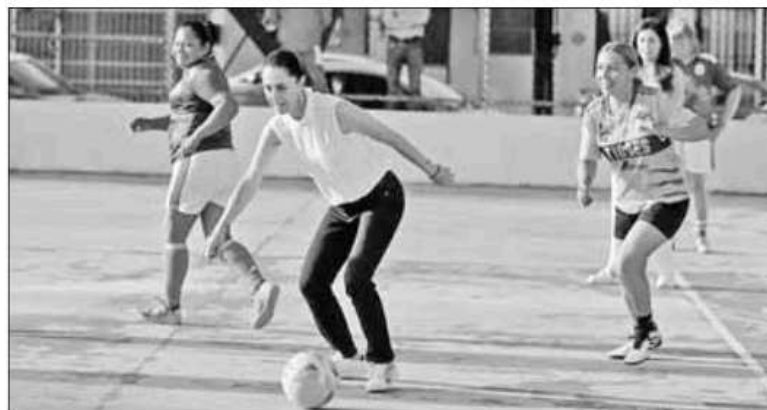
▲ Claudia Sheinbaum, aspirante a coordinar los comités de defensa de la Cuarta Transformación, se echó una cascarita en el