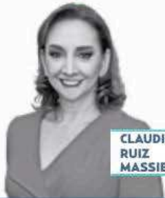
CLAUDIA RUIZ MASSIEU

» Una bancada independiente pretenden constituir los cuatro senadores que el pasado lunes renunciaron al PRI. Claudia Ruiz Massieu, Miguel Osorio, Nuvia Mayorga y Eruviel Ávila buscan recibir el mismo trato que el PRD y el Grupo Plural, que sin tener el mínimo de cinco integrantes que se requieren para formar un grupo parlamentario se les concedió acceso a comisiones y a la Jucopo. Dicen que seguirán con su postura de oposición.