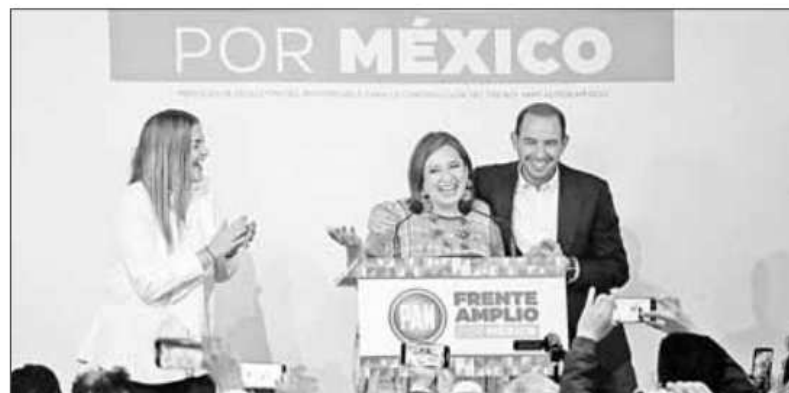
▲ La aspirante a la candidatura presidencial del Frente Amplio por México, Xóchitl Gálvez,

Twitter: @cafevega cfvmexico_sa@hotmail.com