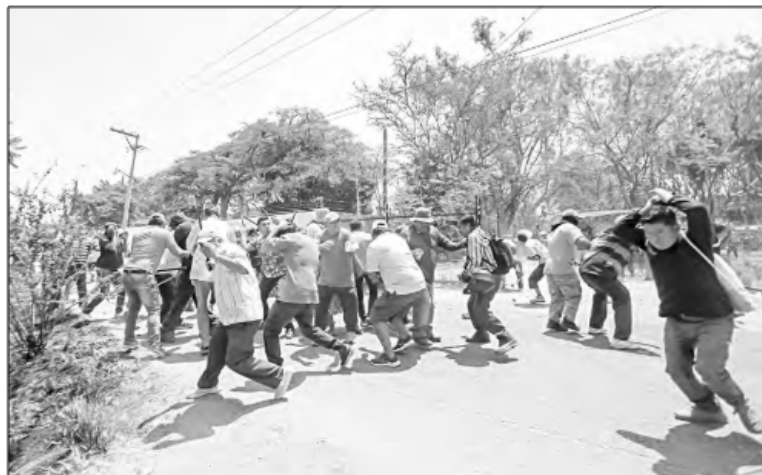
▲ Transportistas y habitantes de San Bautista La Raya intentaron romper un bloqueo de